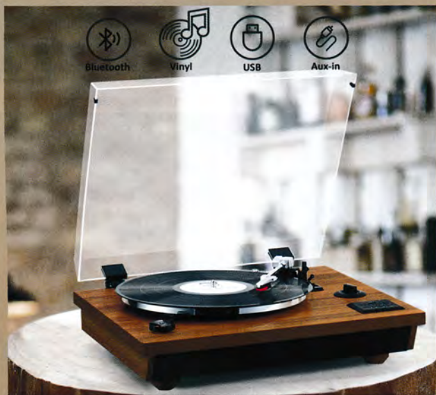
Sieht gut aus und hat was drauf – der neue MC-262